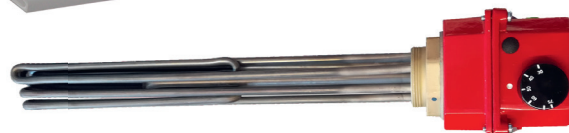
Elpatron 2-10 kW och överhettningsskydd