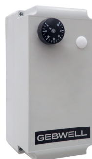
Elpatron 12 kW och överhettningsskydd

Genom att förse ackumulatortanken med en eller flera elpatroner kan man säkerställa ackumulatortankens funktion om uppvärmningssystemet stängs av eller råkar ut för en funktionsstörning. Med en ackumulatortank som är försedd med elpatroner kan man dessutom ta hand om uppvärmningen av ett vedeldat hus under en semester.