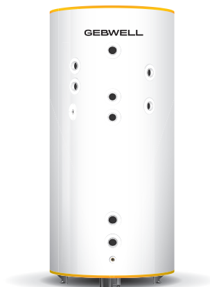
G-Energy Bufferttank SV 1000 L 6SV