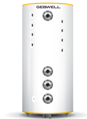
G-Energy Bufferttank SV 1000 L 8SV DN65