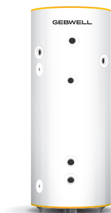
G-Energy Bufferttank 501 L 3SV