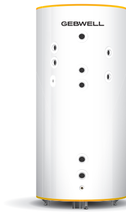
G-Energy Bufferttank SV 1000 L 6SV