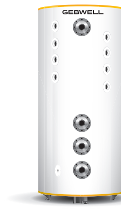
G-Energy Bufferttank SV 1000 L 8SV DN65